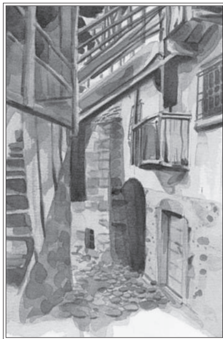
Da La strada Priula : le case di Catremerio con i caratteristici ballatoi.

Piccoli mondi relazionali che la fretta non ti fa vedere, perché ciò che preme è